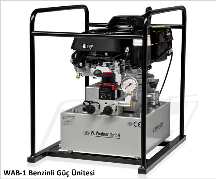
WAB-1 Benzinli Güç Ünitesi